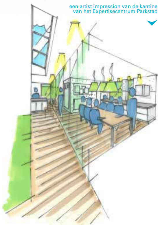
een artist impression van de kantine van het Expertisecentrum Parkstad