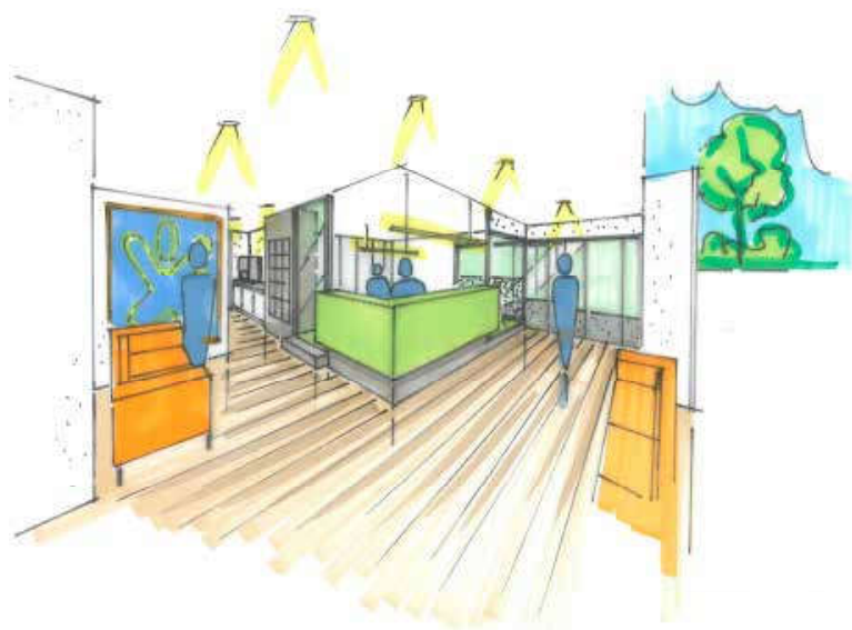
Deze artist impression laat zien hoe de receptie van de totaal vernieuwde locatie aan de Heerlerbaan eruit ziet

In de komende jaren zal het langetermijnhuisvestingsplan verder uitgevoerd worden. Gezien de huidige verwachtingen in het kader van de transitie zijn mogelijk aanpassingen van het plan aan de orde.